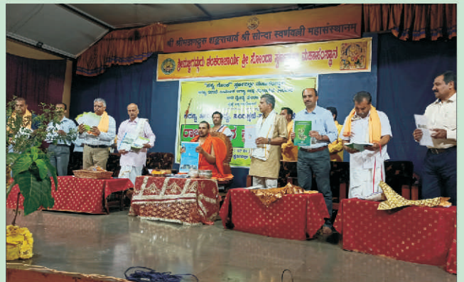
ದಿ. 07.01.2020ರಂದು, ಸೋಂದಾ ಸ್ಥಳದಲ್ಲಿಯ “ಸಸ್ಯಲೋಕ”ದ ಆಶ್ರಯದಲ್ಲಿ, ಮಲೆನಾಡಿನ ಜಿಲ್ಲೆಗಳ ವ್ಯಾಪ್ತಿಯ “ಜೀವವೈವಿಧ್ಯ ಸಂರಕ್ಷಣಾ ಸಮಿತಿಗಳ” ಬಲವರ್ಧನಾ ಕಾರ್ಯಾಗಾರ ದಲ್ಲಿ ಮಂಡಳಿಯ ಅಧ್ಯಕ್ಷರು ಮುಖ್ಯ ಅತಿಥಿಗಳಾಗಿ ಭಾಗವಹಿಸಿದರು.