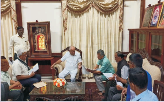
ಸನ್ಮಾನ್ಯ ಮುಖ್ಯಮಂತ್ರಿ ಶ್ರೀ ಬಿ.ಎಸ್. ಯಡ್ವಾರಪ್ಪನವರೊಂದಿಗೆ ಚಿಕ್ಕರ ನಿಯೋಗದ ಭೇಟಿ