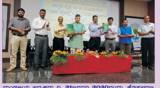
ಮಂಡಳಿಯ ಅಧ್ಯಕ್ಷರು ದಿ. 21ಜನವರಿ 2020ರಂದು, ಕೊಪ್ಪಳದಲ್ಲಿ ಜಿಲ್ಲಾಮಟ್ಟದ ಜೀವವೈವಿಧ್ಯ ಸಂರಕ್ಷಣೆ ಕುರಿತು ಸಮಾಲೋಚನೆ ಹಾಗೂ ತರಬೇತಿ ಕಾರ್ಯಾಗಾರದಲ್ಲಿ ಮುಖ್ಯ ಅತಿಥಿಗಳಾಗಿ ಭಾಗವಹಿಸಿದರು.