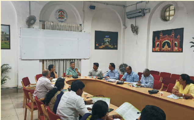
ಮಂಡಳಿಯ ಅಧ್ಯಕ್ಷರು ದಿ. 30.01.2020ರಂದು, ಮೈಸೂರಿನಲ್ಲಿ ಜಿಲ್ಲಾಧಿಕಾರಿಗಳು ಹಾಗೂ ಜ.ಪಂ. ಮುಖ್ಯ ಕಾರ್ಯನಿರ್ವಹಣಾಧಿಕಾರಿಗಳ ಸಮ್ಮುಖದಲ್ಲಿ, ಜಿಲ್ಲೆಯಲ್ಲಿ ಜೀವವೈವಿಧ್ಯ ಕಾನೂನಿನ ಅನುಷ್ಠಾನದ ಪ್ರಗತಿ ಪರಿಶೀಲನಾ ಸಭೆ ನಡೆಸಿದರು.