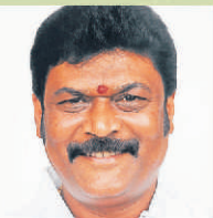
ಸನ್ಮಾನ್ಯ ನೂತನ ಅರಣ್ಯ ಮತ್ತು ಪರಿಸರ ಸಚಿವರಿಗೆ ಸುಸ್ಥಾಪಕ