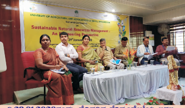
ದಿ.29.01.2020ರಂದು, ಕೊಡಗಿನ ಪೊನ್ನಂಪೇಟೆಯ ಅರಣ್ಯ ಕಾಲೇಜಿನಲ್ಲಿ ಜೀವವೈವಿಧ್ಯ ಸಂರಕ್ಷಣೆ ಕುರಿತು ಜರುಗಿದ ರಾಷ್ಟ್ರೀಯ ಕಾರ್ಯಾಗಾರದಲ್ಲಿ, ಮಂಡಳಿಯ ಅಧ್ಯಕ್ಷರು ಮುಖ್ಯ ಅತಿಥಿಗಳಾಗಿ ಭಾಗವಹಿಸಿದರು.