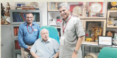
ಪ್ರೊ. ಎಮ್.ಎಸ್. ಸ್ವಾಮಿನಾಥನ್ ಭೇಟಿ

ಕರ್ನಾಟಕ ಸರ್ಕಾರದ ನೂತನ ಅರಣ್ಯ, ಪರಿಸರ ಮತ್ತು ಜೀವಶಾಸ್ತ್ರ ಸಚಿವರಾಗಿ ಅಧಿಕಾರ ಸ್ವೀಕರಿಸಿರುವ ಶ್ರೀ ಅನಂದ ಸಿಂಗ್ ಅವರಿಗೆ ಕರ್ನಾಟಕ ಜೀವವೈವಿಧ್ಯ ಮಂಡಳಿಯು ಗೌರವಪೂರ್ವಕವಾಗಿ ಹಾರ್ಡಿಕ ಸ್ವಾಗತ ಬಯಸುತ್ತದೆ.