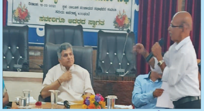
ಕುಮಟಾ ತಾಲ್ಲೂಕು ಪಂಚಾಯತದಲ್ಲ ಜೀವವೈವಿಧ್ಯ ಸಮಿತಿಗಳ ಬಲವರ್ಧನೆ ಕುರಿತು, 01-12-2020ರಂದು, ಮಂಡಳಿಯ ಅಧ್ಯಕ್ಷರು ತಜ್ಞರು ಹಾಗೂ ಜನಪ್ರತಿನಿಧಿಗಳ ಜೊತೆ ಮಾಲೋಚನಾ ಸಭೆ ನಡೆಸಿದರು.