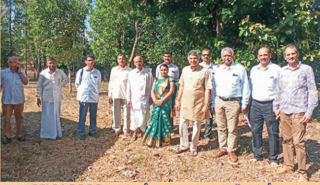
01.07.2020ರಂದು ನೋಂದಾ ಬಳಯ "ಸಸ್ಯಲೋಕ ಸನ್ಮೋದ್ಯಾನ"ಕ್ಕೆ ಮಂಡಳಿಯ ಅಧ್ಯಕ್ಷರು ವಿವಿಧ ತಜ್ಞರು ಹಾಗೂ ಜನಪ್ರತಿನಿಧಿಗಳೊಂದಿಗೆ ಭೇಟಿಯಾಯಿತು. ಸಂರಕ್ಷಿಸಿರುವ ವಿನಾಶದಂಚನ ಸಸ್ಯವೈವಿಧ್ಯವನ್ನು ವಿಶ್ಲೇಷಿಸಿದರು.